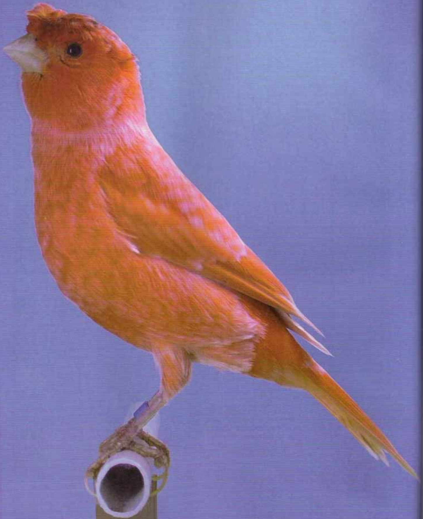
Magnífico ejemplar de Moña Alemana.