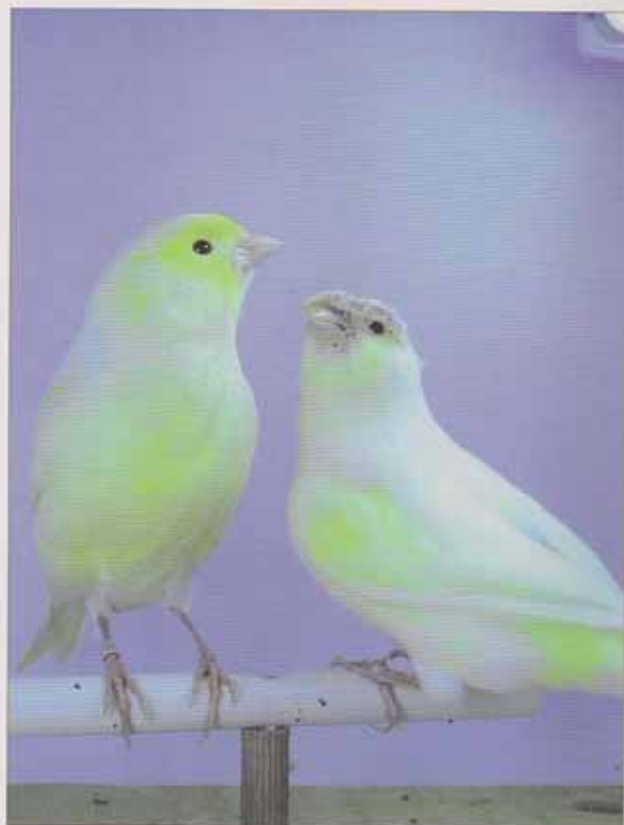
Pareja en Amarillo Mosaico.

son esenciales a la hora de formar una pareja, aunque hay comentarios de otros criadores que para ellos da igual cruzarlo con un pájaro que no proceda de moñudo, muy respetable la opinión pero yo no la comparto por tanta experiencia y estudio que llevo elaborando todos estos años con la cría selectiva del moña alemana, y más aun cuando no trabajas con solo un lipocromo, sino en mi caso que selecciono el moña alemana en "Blanco Recesivo, Amarillo